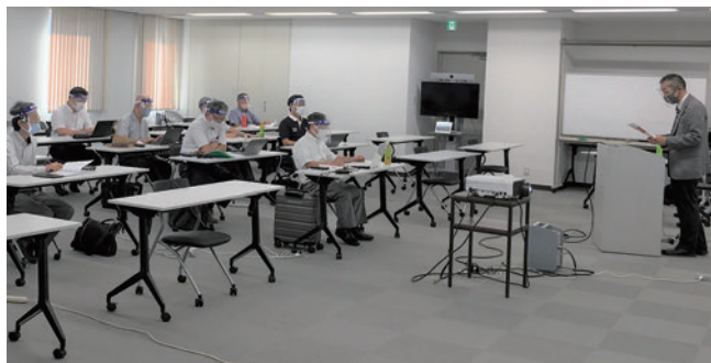
「3密」に配慮した審査員研修の実施状況

MSA では一時中断していた審査員研修を再開しました。再開に当たっては、マスク及びフェイスシールドの着用、マイクの使用の際には使用者毎にマイクの消毒を事前に行うなど徹底した感染防止対策を行っております。また少人数制で複数回実施することにより、「3密」にならないよう配慮した対応を行っております。